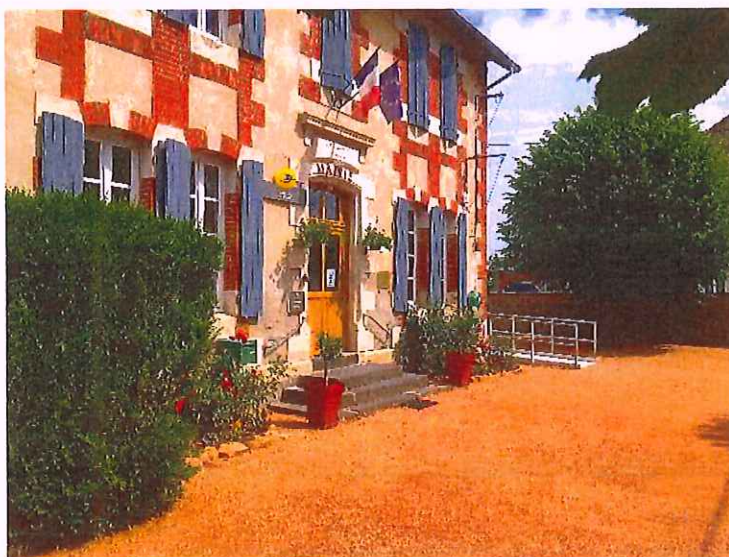
Légende de l'image : Aperçu du fleurissement du bâtiment de la mairie

Nous vous souhaitons un bel été ensoleillé.