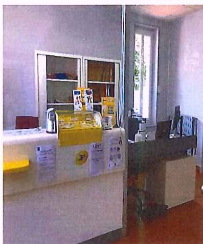
Légende de l'image : Nouveau bureau de la Mairie et de l'Agence Postale Communale

L'Agence Postale Communale est ouverte depuis le lundi 3 mai 2021.